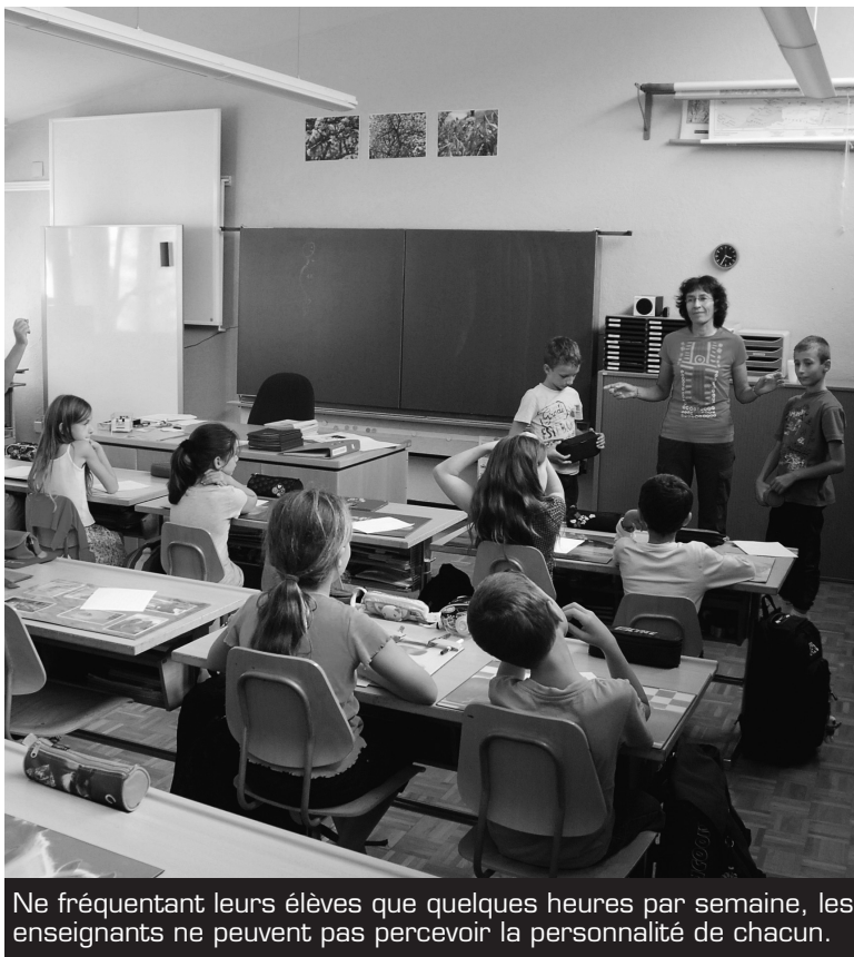
Ne fréquentant leurs élèves que quelques heures par semaine, les enseignants ne peuvent pas percevoir la personnalité de chacun.

Indépendamment de leurs causes potentielles, les résultats de cette étude suggèrent que les enseignants n'ont souvent pas les moyens d'être les acteurs de première ligne de la prévention secondaire, laquelle implique d'identifier les élèves à risque afin de leur proposer un soutien spécifique. Dans ce contexte, il est important de cumuler les sources d'information, soit, par exemple, les propos de l'élève concerné et de ses camarades, les observations des parents et d'autres acteurs éducatifs (entraîneurs ou moniteurs) ainsi que les arrestations par la police. Les enseignants restent néanmoins des acteurs centraux de la prévention primaire de la délinquance, qui couvre l'ensemble des élèves. Ils peuvent faire usage d'outils dont l'efficacité a été scientifiquement démontrée: une information claire sur les comportements non acceptés et les sanc-