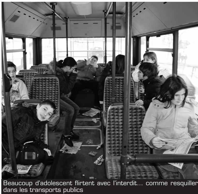
Beaucoup d'adolescent flirtent avec l'interdit... comme resquiller dans les transports publics

Ce «flirt avec l'interdit» n'est pas innocent; il peut mettre l'adolescent sur le fil du rasoir, c'est-à-dire qu'il encourt le risque de compromettre sa santé ou de comparaître devant le juge. Ainsi, les 14-17 ans remportent, depuis les années 80, le triste record du taux le plus élevé de jugements (1,8% contre 0,4% pour les adultes, selon l'Office fédéral de la statistique). La prévention ne semble donc pas être un vain mot dans ce