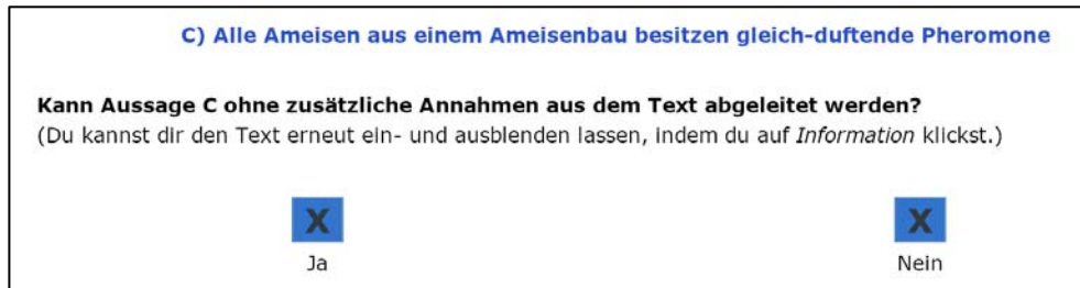
Abbildung 1: Beispiel einer Aussage bezüglich eines Textes zur Organisation eines Ameisenbaues

abstrakte Denkweisen von den Studenten abverlangen, erfordert. Um das abstrakte Denken zu testen werden Puzzles vorgestellt deren Systematik es zu erkennen und die es zu vervollständigen gilt (siehe Abbildung 2). Pro Aufgabe stehen 170 Sekunden zur Verfügung, vor dem Antworten müssen 10 Sekunden abgewartet werden.