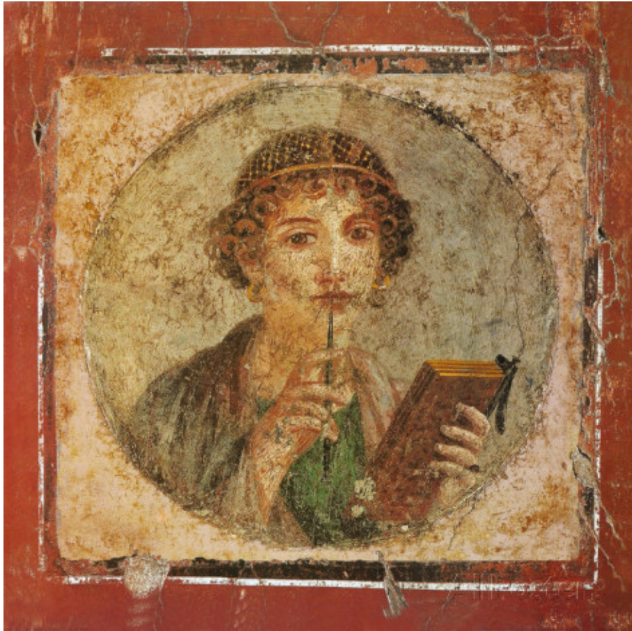
Fig. 1 : Portrait d'une jeune fille, dit « de Sappho », Pompéi, 1 er s. p.C. Fresque, diamètre : 29 cm. Musée archéologique national, Naples.