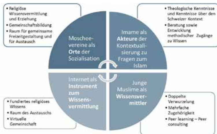
Abbildung 2: Interventionsbereiche von muslimischen Organisationen (Schaubild SZIG)

Jeder dieser Bereiche eröffnet vielversprechende Perspektiven, stösst jedoch auch auf Hindernisse.