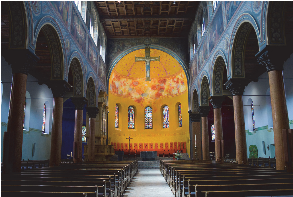
Abbildung: Innenraum und Apsis der Dreifaltigkeitskirche, Bern

Jahresversammlung, Samstag, 13. April 2024 in Bern (s. Programm mit genauen Ortsangaben)